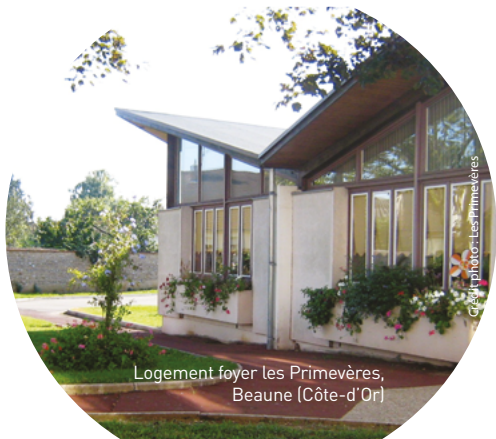
Logement foyer les Primevères, Beaune (Côte-d'Or)